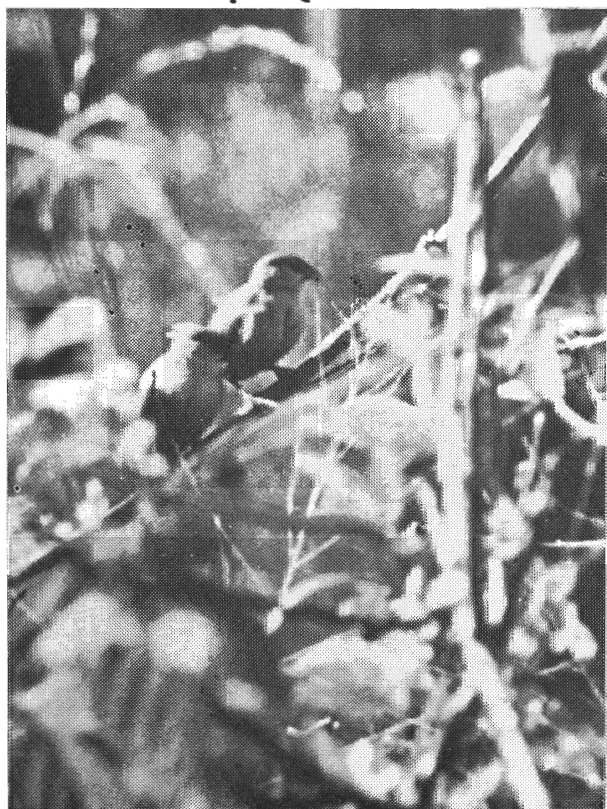
Fig. 1. Estrilda astrild em Manaus, agosto de 1978.

O pássaro africano Estrilda astrild (Estrilidae) é a única ave exótica, com exceção da pomba-comum ( Columba livia ), que colonizou com sucesso a Amazônia Central. Notado primeiramente em Manaus em 1967 (Sick, 1968), a população atual é estimada entre 500 e 1.000 indivíduos. O nome vulgar de E. astrild no Brasil é bico-de-lacre, espécie originalmente encontrada em quase toda a África tropical (De Schauensee, 1966). O pássaro mede aproximadamente 12 cm e é de uma cor quase completamente cinza, com sobrelhas encarnadas, bico encarnado e uma cauda com forma redonda. Machos e fêmeas são iguais (Fig. 1).