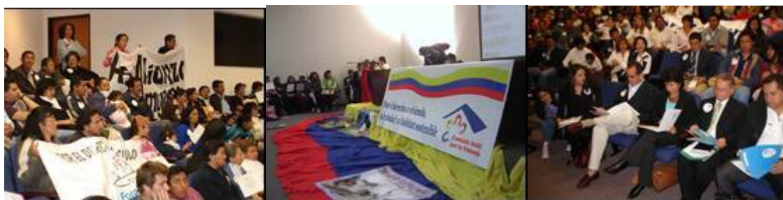
Fig. 4 Entrega de la demanda ciudadana por el derecho a la vivienda, la ciudad y el Hábitat a los asambleístas, Quito, 8 nov. 2007