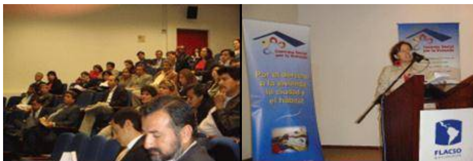
Fig. 7 Encuentro “Democratización del financiamiento para vivienda de interés social, diálogo de actores”.

El colectivo logró el enlace con el Ministerio de Coordinación de la Política Económica (MCPE), para estar presente en las reuniones en las que se discutían las propuestas de la nueva estructura financiera y su relación con la política de crédito y vivienda en el contexto de definición de nuevas políticas de estado.