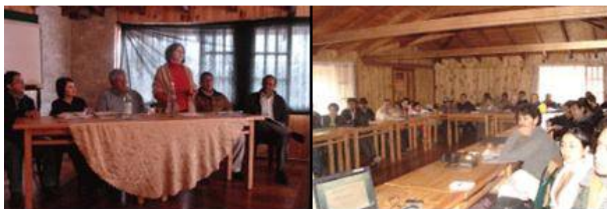
Fig. 6 Intercambio de experiencias de vivienda rural, México, Bolivia, Ecuador, Nicaragua, Toacaso, 24-26 julio, 2008

En una segunda instancia el CSV busca incidir en la formulación e implementación de una política de Estado concertada con los grupos sociales organizados, el sector privado y los gobiernos locales, con la finalidad de construir respuestas institucionales socialmente eficaces, responsables y equitativas. Es necesaria la construcción de una política de Estado que enfrente los problemas inmediatos y las demandas urgentes de las familias, sin perder de vista las propuestas para mejorar las condiciones habitacionales y la calidad de vida a mediano y largo plazo. En esa línea se desarrollan espacios de diálogo con instancias públicas, talleres de discusión y análisis de los problemas de la vivienda, la ciudad y el hábitat, y se elaboran propuestas de lineamientos de política.