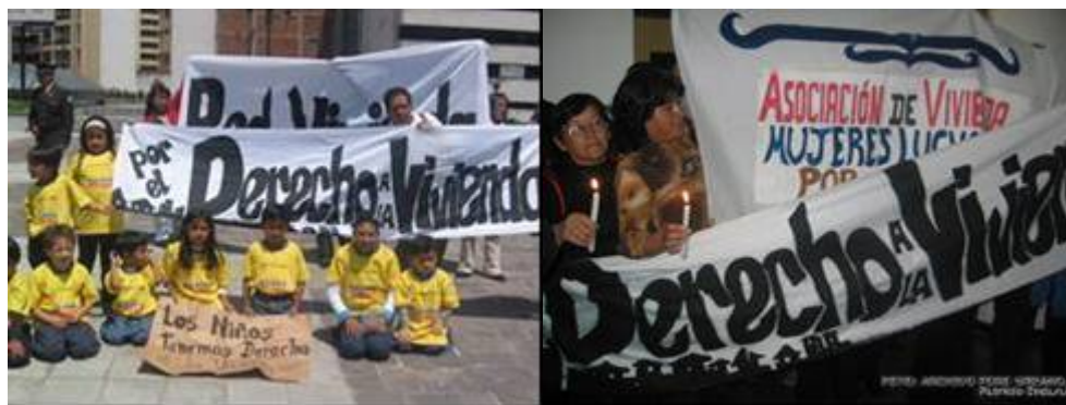
Fig. 1 Movilización por la restitución del bono de la vivienda

Debido a que el país pasaba por un proceso convulsionado de cambios políticos, fue necesario en cada momento remarcar ante las entidades públicas sobre el estado crítico que enfrentaba la situación habitacional y cuál es la responsabilidad y los compromisos que el Estado no había cumplido, igualmente era necesario buscar soluciones a la gran dificultad en la articulación de las diferentes carteras ministeriales, a la lentitud en el flujo de los fondos ya comprometidos, y sobretodo enfrentar el riesgo inminente de desaparecer el subsidio habitacional.