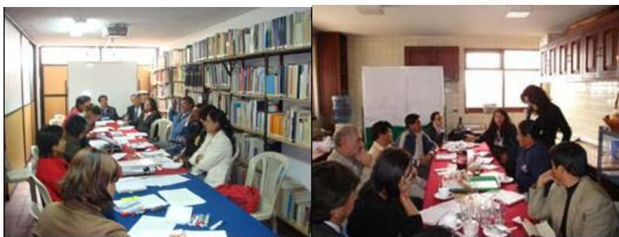
Fig. 3 Mesa de trabajo del Contrato Social por la Vivienda

Las reuniones de coordinación del colectivo tienen diversidad de objetivos, que se plantean como parte del seguimiento de la agenda y como respuesta a contextos coyunturales relevantes. En estos foros se trata y evalúa la estrategia de incidencia, las modalidades de acercamiento entre la sociedad civil y las entidades y actores públicos, los técnicos y los tomadores de decisiones. Se definen los temas relevantes y aquellos en los cuales hay mayor potencial de incidencia, aquellos temas en los cuales el colectivo tiene capacidades, información y propuestas. Entre 2006 y el 2008 se desarrollaron un total de 59 reuniones de coordinación interna y planificación de actividades del CSV. (Ruiz, S. 2009)