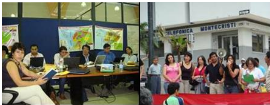
Fig. 5 Marcha ciudadana del hacia la Asamblea Constituyente - Presentación de la demanda ciudadana del CSV en la Mesa 7: Régimen de Desarrollo Asamblea Constituyente 2008, Montecristi, 8 de febrero 2008

La “demanda ciudadana por el derecho a la vivienda, la ciudad y el hábitat”, recoge los planteamientos de la ciudadanía frente a estos derechos y los planteamientos que se han realizado desde los grandes Foros Mundiales y Regionales, Foros Urbanos, Foros Sociales, con amplia participación de la sociedad civil en Porto Alegre, Estambul, Quito, Barcelona, Canadá entre otros.