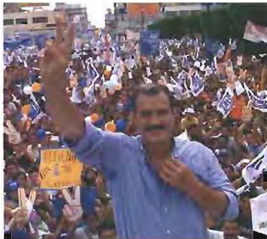
GUERRILLA Y CAMBIO. La figura del indigenista subcomandante Marcos convive hoy en el México de Vicente Fox, el hombre que pudo con el enquistado PRI.

elemento clave para la población: un sistema identitario que reconstruye la sensación de pertenencia.