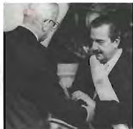
EL DRAMA ARGENTINO. El populismo se personaliza en América con el triunfo de Perón (1946) y el carisma de Evita lo consolida. El modelo de Estado nacional-popular, interrumpido por los militares en 1955, se recupera en 1972 y vuelve a caer en 1976 bajo el sable de Videla. Tras el fiasco de las Malvinas, Alfonsín abre en 1983 un período acosado por un neopopulismo de gestos y esquilador.

pular se agotó, en un contexto signado por la crisis social, económica y política, especialmente en los países del Cono Sur, crisis que dieron paso a las brutales dictaduras militares. La caída de este modelo de Estado surgió de la combinación de varios factores. Primero, se asistió a una crisis del crecimiento económico, que eliminó una pata del "tripode" en el que se asentaba el modelo: cayó la capacidad distributiva del Estado. Esto se debió a la imposibilidad de transitar de la fase "simple" de sustitución de importaciones —la de los bienes de consumo masivo— a la siguiente fase, la producción de bienes de capital. Las economías latinoamericanas tuvieron que flexibilizarse. Son las reformas que empiezan a emprender gobernantes como el general Pinochet.