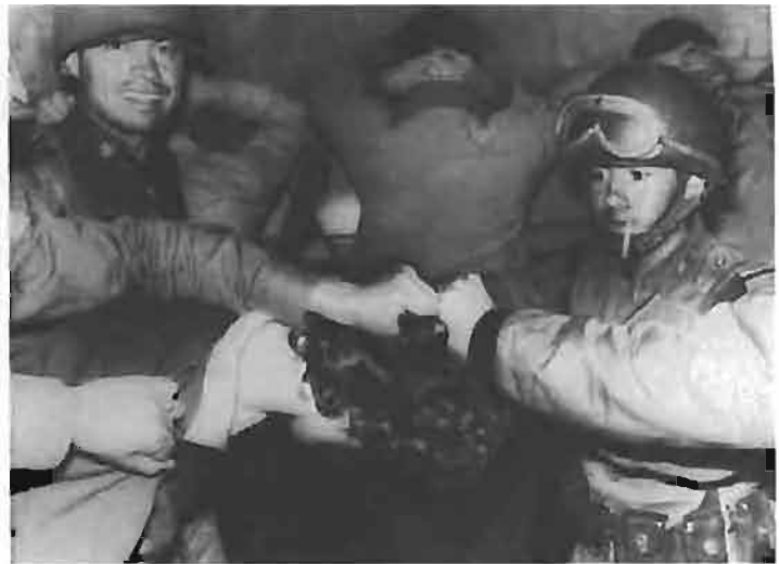
LA CONTUNDENCIA DEL PODER. México, plaza de las Tres Culturas en Tlatelolco, noviembre de 1968. El ejército del PRI reprime a sangre y fuego -unos 300 muertos- la rebeldía estudiantil.

Naciones Unidas para América Latina (CEPAL 1948), fue una política en ejecución inconsciente. Esta lógica económica incrementó la relevancia de los asalariados y aceleró procesos de inclusión de amplios sectores en la gestión gubernamental. Ni la clase media, ni los trabajadores, ni los campesinos fueron relevantes en el Estado oligárquico liberal.