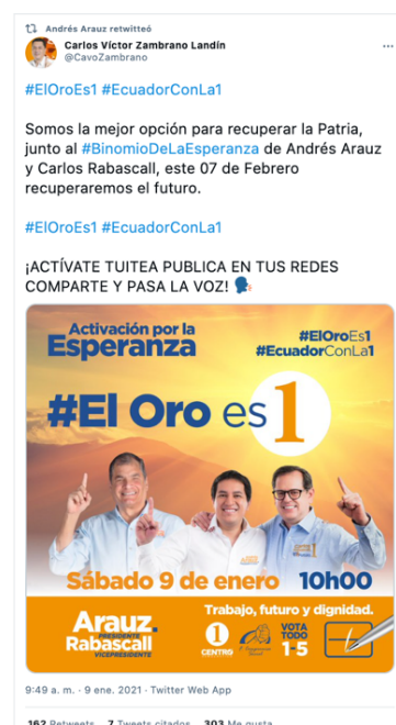
Ilustración 4. Mensaje de esperanza de Arauz durante la campaña electoral ecuatoriana