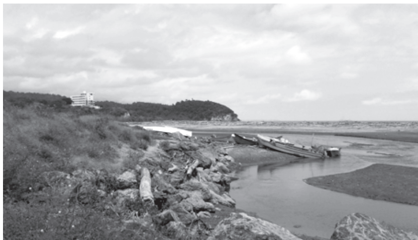
Imagen 4. Desembocadura Río Coaque, acceso al mar, asentamiento La Playita. Agosto de 2016.