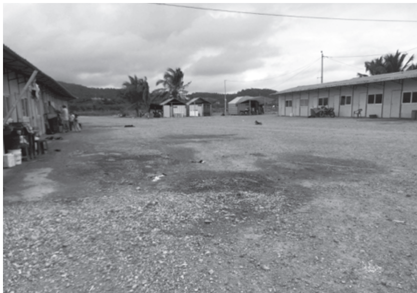
Imagen 3. Viviendas prefabricadas, donadas después del terremoto, La Playita. Julio de 2016.

La reubicación quedó en el aire por falta de recursos y desatención del municipio, y las familias se negaron a abandonar la zona, donde se encontraban sus medios de vida.