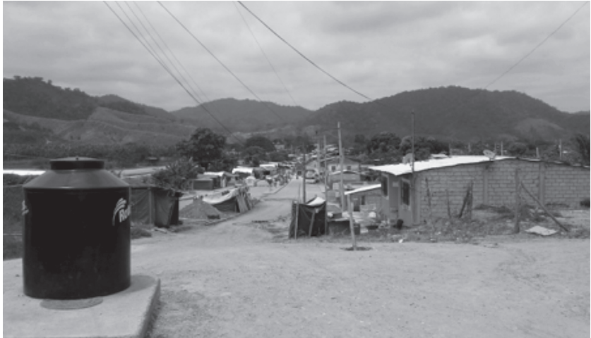
Imagen 2. Entrada al poblado de Coaque. Julio de 2016.

Viteri, Chunga, Ordoñez y De Teresa, 2016). Los servicios sociales comprenden un Centro de Salud del Seguro Social Campesino, un Centro de Educación Básica y un Centro Infantil del Buen Vivir; todos ellos se vieron afectados.