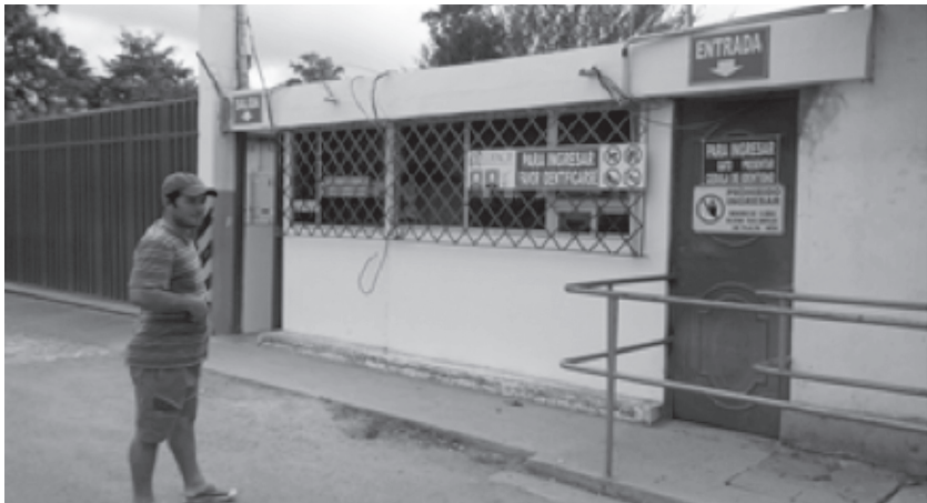
Imagen 6. Entrada a la empacadora de camarón. Septiembre de 2016.

Situada en Coaque, tuvimos ocasión de visitar la planta de forma fortuita. Las secciones se organizan según el valor agregado que se genera. Otras unidades, como la hielera, incorporan trabajadores sin relación de dependencia que facturan como cuadrilla a la empresa.