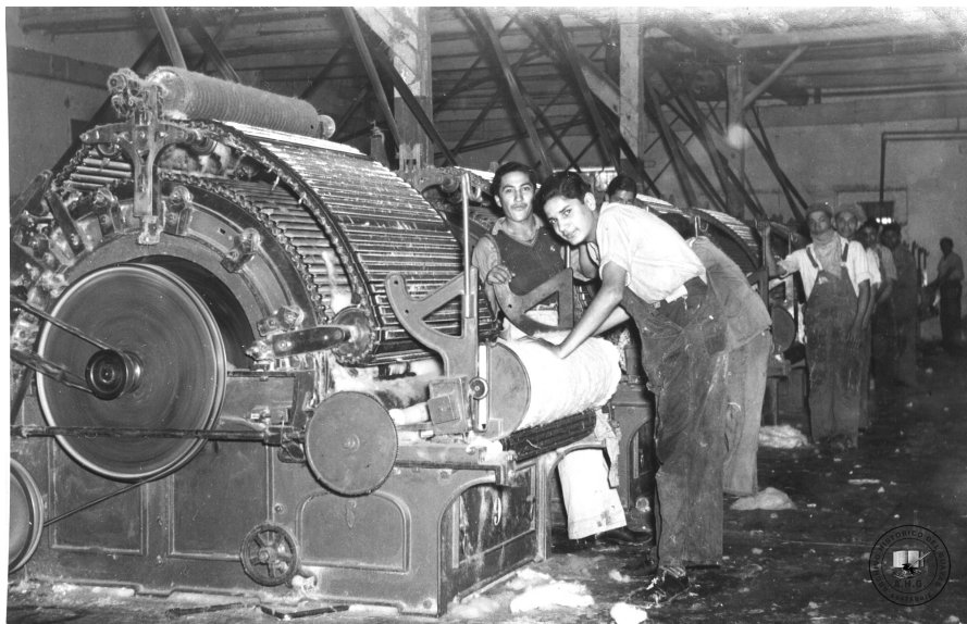
Foto 1. Fábrica La Industrial, maquinaria de la sección Cardas, en Archivo Histórico del Guayas.

Entre 1920 y 1940 ocurrió la mayor expansión: se fundaron decenas de nuevas empresas, muchas como sociedades anónimas (cuadro 1 y gráfico 1) cuyos dueños ya pueden ser considerados “empresarios”, diferentes de los dueños de obrajes. También hubo apoyo estatal para las empresas y para la producción de algodón en la Costa: de hecho, si bien en el Ecuador no se consolidó la industrialización como en otras naciones latinoamericanas, el sector textil fue una excepción. Un caso representativo fue la fábrica La Internacional, que empezó como Sociedad de Crédito en 1921 y cuyos socios, un año después, decidieron invertir en producción de tejidos; su gerente Luis Napoleón Dillon viajó a Europa para importar maquinaria que llegó a Quito a comienzos de 1923. La Internacional adquirió un terreno en Chimbacalle, cerca de la estación de tren, donde se edificaron instalaciones fabriles con el mismo estilo arquitectónico que se usaría luego para construir La Industrial. En las instalaciones de La Internacional fue además donde se incubó, en los siguientes años, la primera organización sindical de la emergente clase obrera industrial de la ciudad. 9